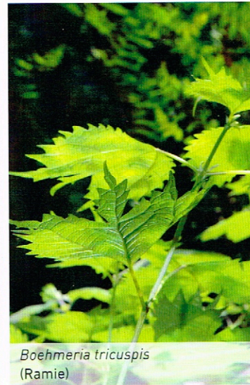
Boehmeria tricuspis (Ramie)