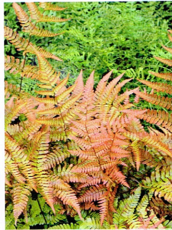
Dryopteris erythrosora (Rotschleierfarn)