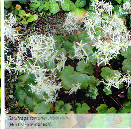
Saxifraga fortunei 'Rubrifolia' (Herbst-Steinbrech)

Caroline Zollinger (4); Fredi Ungricht (2: untere Zeile links und rechts, en bas à gauche et à droite)