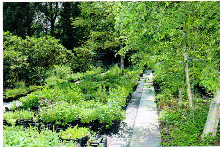
Caroline Zollinger (2)