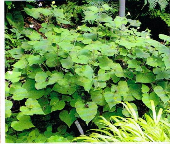
Saruma henry (Saruma) und Hakonechloa macra 'Aureola' (Japanisches Waldgras)