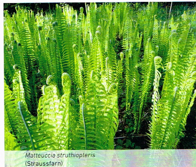
Matteuccia struthiopteris (Straussfarn)