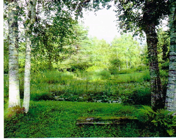
Fredy Ungricht (2)